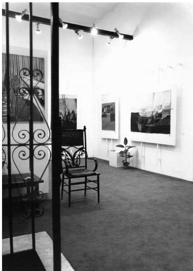
1964-Galería El Sol

Me centraré en el resurgimiento del arte textil en nuestro país en la década del '60. Me sorprendió el azar y no puedo ignorarlo. Ordenando mi biblioteca, se deslizó un sobre con registros periodísticos del año 1966. Todos los diarios de Buenos Aires se hacían eco del fallecimiento de Jean Lurçat, del cual en este año 2016