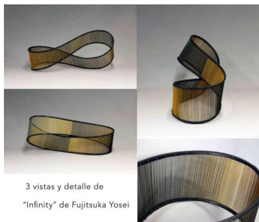
3 vistas y detalle de "Infinity" de Fujitsuka Yosei

Se adjuntan aquí algunos ejemplos, no todos de piezas artísticas.