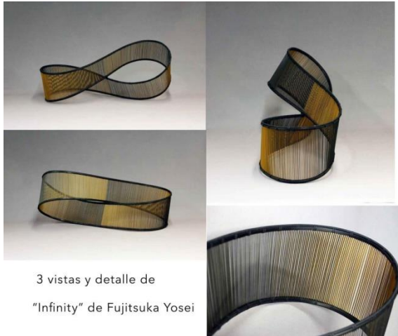
3 vistas y detalle de "Infinity" de Fujitsuka Yosei

No hay una única manera de presentar la pieza, tener en cuenta que es importante para tomar la fotografía seleccionar el ángulo que mejor permita apreciar la obra en su totalidad. Se adjuntan aquí algunos ejemplos, no todos de piezas artísticas.